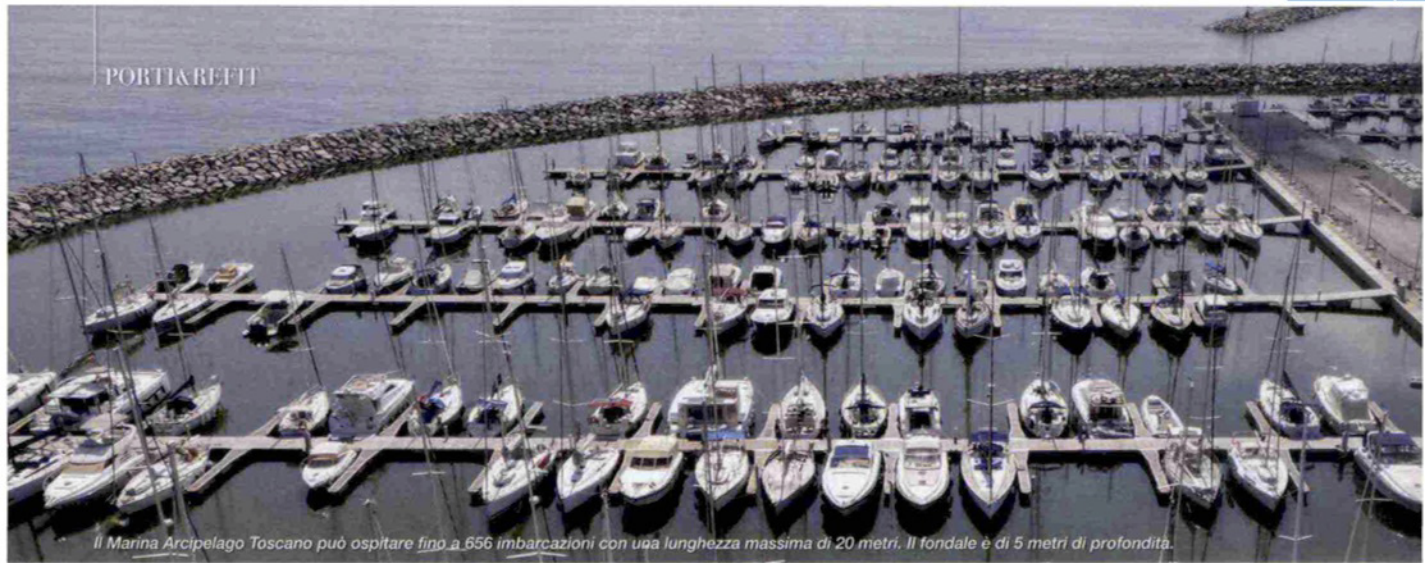
Il Marina Arcipelago Toscano può ospitare fino a 656 imbarcazioni con una lunghezza massima di 20 metri. Il fondale è di 5 metri di profondità.